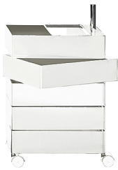
Glossy colour White 1673 C