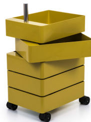
Glossy colour Yellow 1018 C