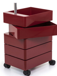
Glossy colour Bordeaux 1130 C