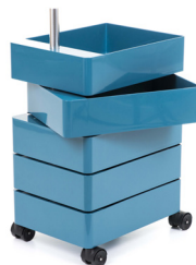
Glossy colour Blue 1234 C