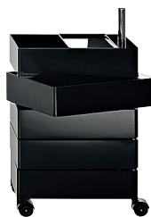
Glossy colour Black 1764 C