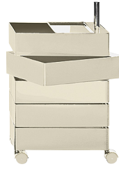
Glossy colour Light Grey 1707 C