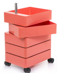
Glossy colour pink 1630 C