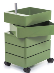
Glossy colour Green 1321 C